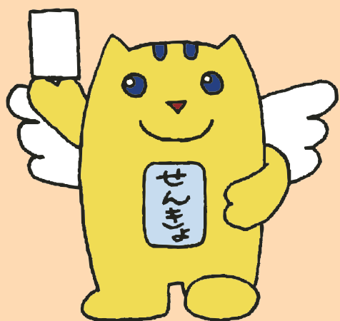
明るい選挙のイメージキャラクター “選挙のめいすいくん”