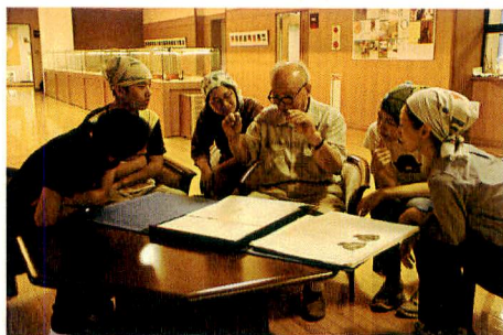
川北所長との語らい