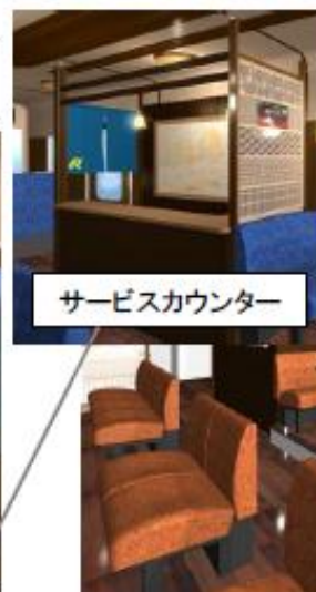
サービスカウンター