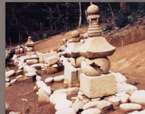
墓地に立つ石塔(復元) (能美市宮竹墓谷中世墓群)