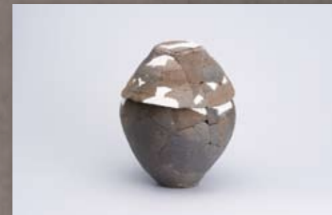
珠洲焼の蔵骨器 (珠洲市だいじょう寺畑遺跡)

今回の展示では、人が亡くなった時に、時代に応じていろいろな形でおこなわれてきた吊いや祈りの様子を、古代末から近世を中心にとりあげていきます。