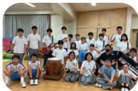
いしかわ特別支援学校, 金沢向陽高校

1 いしかわ特別支援学校和太鼓演奏 金沢向陽高校軽音楽部演奏 いしかわ特別支援学校×金沢向陽高校によるコラボ演奏