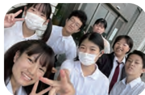
奈良県立ろう学校