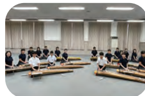
盲学校, 金沢桜丘高校

2 盲学校×視覚障害のあるプロ奏者演奏 盲学校×金沢桜丘高校によるコラボ演奏 金沢桜丘高校箏曲部演奏