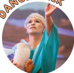
大前光市 (おおまえこういち)

岐阜県出身。小学生の頃から新聞配達を10年以上続け、18歳から産経新聞奨学生として大阪芸術大学舞台芸術学科舞踊コースに通い卒業。卒業後にNoism04の最終オーディション直前に車に引かれ左足の膝下を切断するも、その後10年かけて様々なダンスや身体操作などを習得し国内外のコンクールにて賞を受賞しはじめる。 2016年リオデジャネイロ・パラリンピック開会式のソロ出演を機に一躍脚光を浴び、世界がガラリと変わる。 第68回紅白歌合戦で平井堅と共演しそれをNHKスペシャルで特集され大きな反響を呼ぶ。東京2020オリンピック聖火ランナーにも選ばれ、東京2020パラリンピック開会式にもメインキャストとして出演。その年に自伝『ほくらしく踊る』を学研プラスから出版。2023年には日本舞踊英御流の名取となり英御流光市を襲名する。