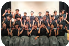
ろう学校, 田鶴浜高校

3 ろう学校×田鶴浜高校 手話ポエム 手話パフォーマンス甲子園過去4大会優勝校 奈良県立ろう学校による手話劇及び 3校によるパフォーマンス