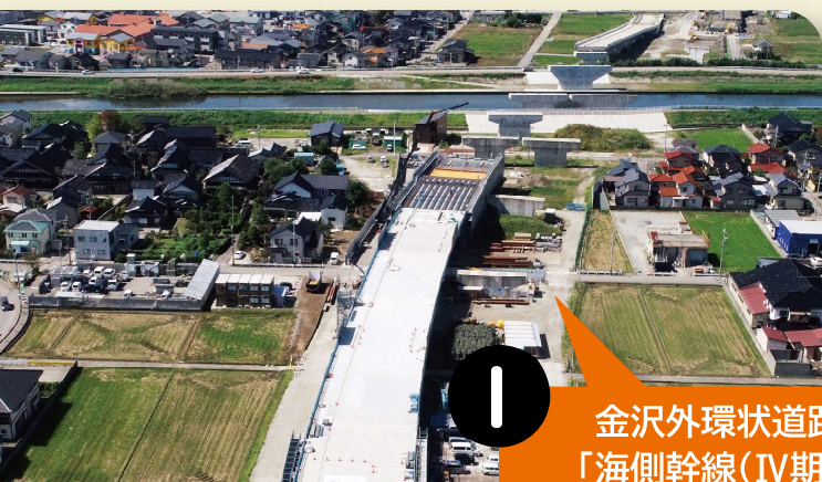
1 金沢外環状道路 「海側幹線(IV期)」

「土木」の魅力や重要性を理解して頂くことを目的として、金沢市内4箇所の土木施設・工事現場を見学します。