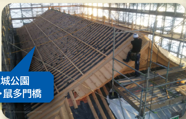
3 金沢城公園 鼠多門・鼠多門橋