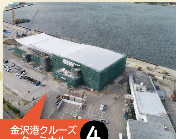
4 金沢港クルーズ ターミナル