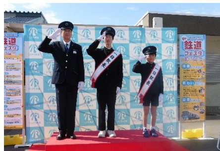
写真は昨年の様子