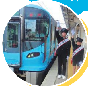
※写真は昨年の1日駅長です

対象 中学生、小学生(4年生以上) 2名 申込期限 2019/10/3(木) 必要事項をご記入の上、 メール又は郵便はがきでご応募ください。