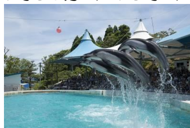
イルカ・アシカショー