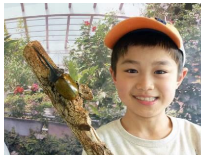
ヘラクレスとツーショット