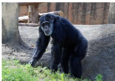
チンパンジー「イチロー」