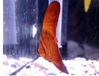
ナンヨウツバメウオ