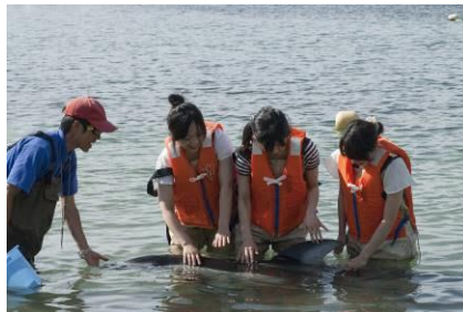
イルカとのふれあいビーチ

( https://www.notoaqua.jp/beach/ )をご確認ください。