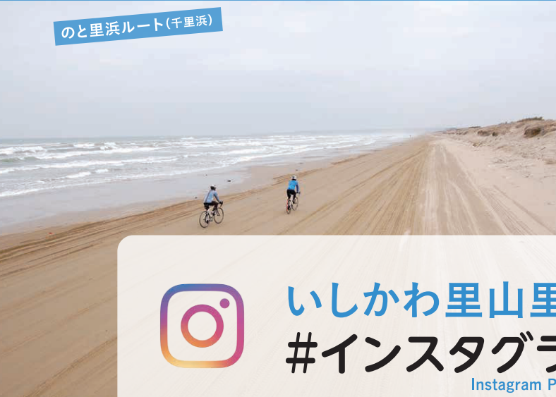
のと里浜ルート(千里浜)