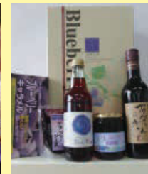
ブルーベリーワイン