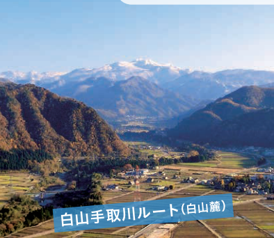
白山手取川ルート(白山麓)