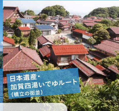
日本遺産・加賀四湯いでゆルート(橋立の街並)