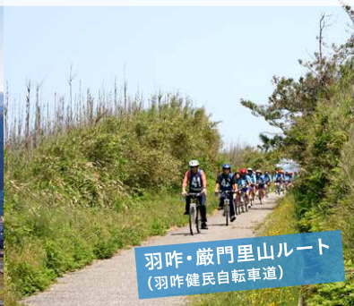
羽咋・巖門里山ルート(羽咋健民自転車道)