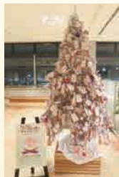
パープルリボンツリー

「パープルリボンツリー」とはツリーをパープルリボンで装飾したもので、県内各地で設置しています。ツリーのそばに置いてあるメッセージカードに、DVや性暴力等のない社会にむけたあなたのメッセージを記入し、ツリーに結びつけませんか。