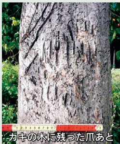
カキの木に残った爪あと