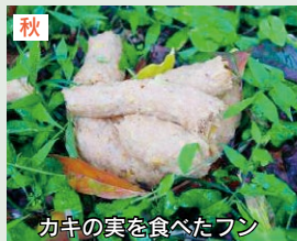
カキの実を食べたフン