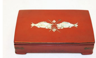
永瀬清子遺品宝石箱 石川近代文学館蔵