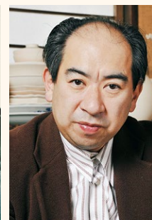
重要無形文化財 「色絵磁器」保持者 十四代今泉今右衛門 氏