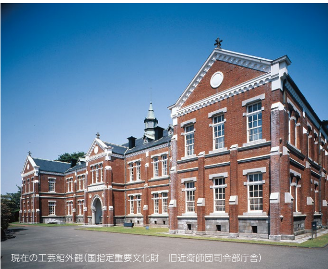
現在の工芸館外観(国指定重要文化財 旧近衛師団司令部庁舎)