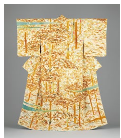
稲垣稔次郎《結城紬地型絵染着物 竹林》1958年