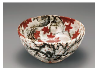
荒川豊蔵《色絵雲錦鉢》1971年 東京国立近代美術館蔵

2月11日(火・祝) 14:00～14:40 成田暢(東京国立近代美術館工芸課特定研究員)