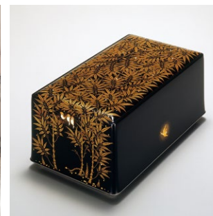
松田権六《蒔絵竹林文箱》1965年 (東京国立近代美術館蔵)