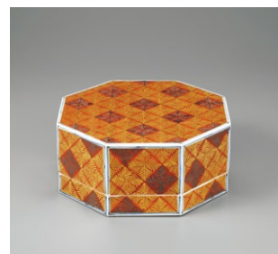
富本憲吉《色絵金銀彩羊歯文八角飾箱》1959年