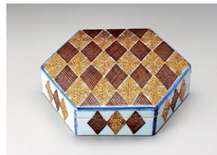
富本憲吉《色絵金銀彩羊歯文六角小箱》 1961年 東京国立近代美術館蔵