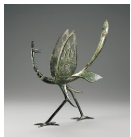
佐々木象堂《蠟型銅置物 瑞鳥》1958年