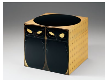
田口善国《日触蒔絵箱》1963年 東京国立近代美術館蔵

休館日/会期中無休 観覧料/一般370(290)円、大学生290(230)円 ( )内は20名以上の団体料金、高校生以下無料