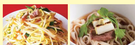
●小松名物塩焼きそば ●加賀のかがやき