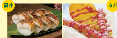
●焼き鯖すし ●京都向日市激辛商店街 (クレープのお店 オンリー)