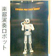
楽器演奏ロボット