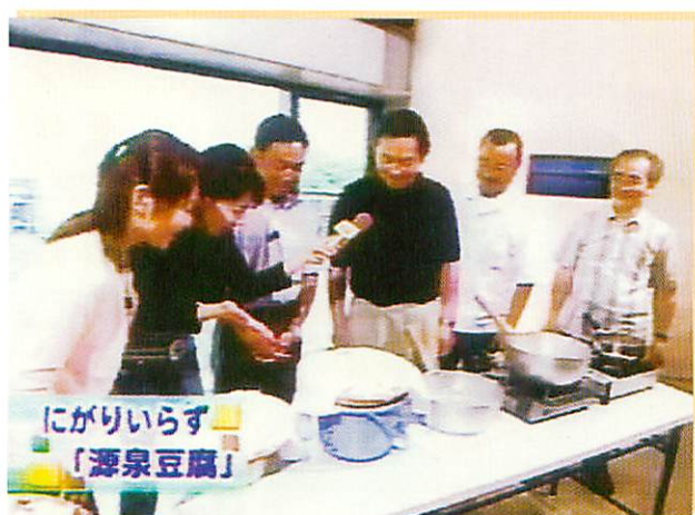
にがりいらず「源泉豆腐」

このように、片山津温泉の恵まれた自然と環境を基に今までになかった発想で提案し、これを機に少しでも地元活性化の起爆剤になればと思っています。これからの温泉地として観光地として生き残るために他の温泉地との差別化を図り、片山津温泉だけの特産品をアピールして行きたいと思っています。