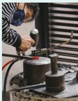
刃物(カンナ)づくり