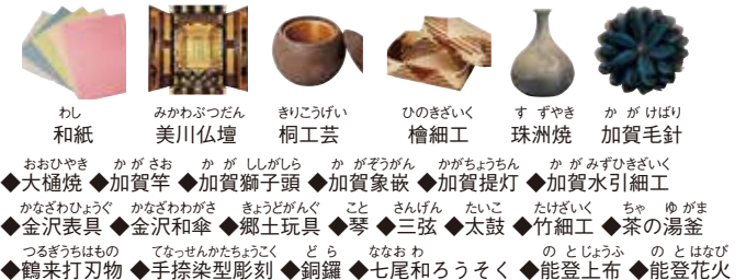
わし 和紙 みかわぶつだん 美川仏壇 きりこうげい 桐工芸 ひのきざいく 檜細工 すずやき 珠洲焼 かがげぼり 加賀毛針 おおひやき かがさお かがししがら かがそうがん かがちようちん かがみずひざいく ◆大樋焼 ◆加賀竿 ◆加賀獅子頭 ◆加賀家嵌 ◆加賀提灯 ◆加賀水引細工 かなざわひょうく かなざわわがさ きょうどがんぐ こと さんげん たいこ たけざいく ちゃ ちやがま ◆金沢表具 ◆金沢和傘 ◆郷土玩具 ◆琴 ◆三弦 ◆太鼓 ◆竹細工 ◆茶の湯釜 つるぎうちものはも てなっせんかたちようこく どもら ななおわ の とじょうふ の とはなび ◆鶴来打刀物 ◆手捺染型彫刻 ◆銅鐘 ◆七尾和ろうそく ◆能登上布 ◆能登火花