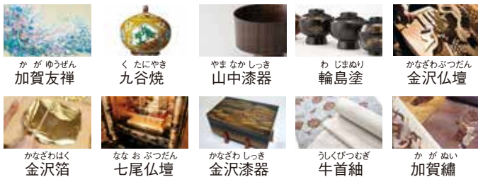
かがゆうぜん 加賀友禅 くにたにやき 九谷焼 やまなかしつき 山中漆器 わじまぬり 輪島塗 かなざわぶつだん 金沢仏壇 かなざわはく 金沢箔 なな おぶつだん 七尾仏壇 かなざわしつき 金沢漆器 うくびつむぎ 牛首袖 かがぬい 加賀繻