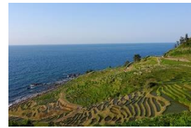
白米千枚田（輪島市）

豊かな里山里海や伝統文化が残る能登地域は、2011年に日本で初めて世界農業遺産「能登の里山里海」に認定されました。一方、人口減少と高齢化の進行により、農林漁業や伝統行事の維持・継承が困難になっている地区もあり、地域活性化や担い手不足の解消などが課題となっています。