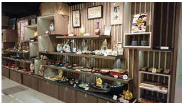
香港アンテナショップ

香港及びシンガポールの大手百貨店において、海外アンテナショップを開設し、現地でのテストマーケティングや、現地消費者に対する県産品の魅力のPRを行っています。