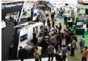
ME X 金沢

県外企業からの受注あっせんや、県内企業が有する高い技術を大手メーカーに提案する商談会、大規模見本市の開催などを支援していきます。