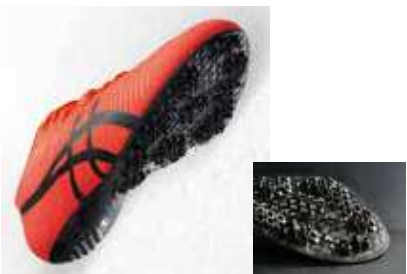
陸上短距離用シューズのソール（靴底）