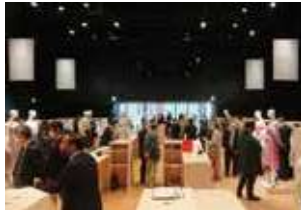
アパレル産業連絡懇談会