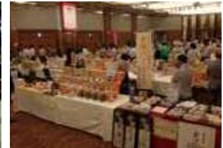
食品王国いしかわ百万石マルシェ