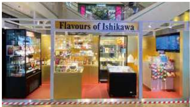
シンガポールアンテナショップ