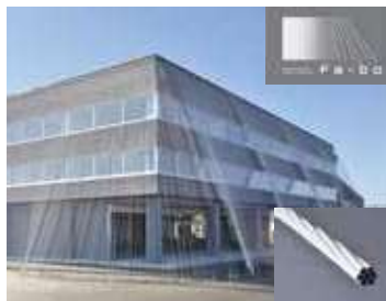
建築建造物の耐震補強材

強くて軽いという特性から車体軽量化による省燃費化など、カーボンニュートラルに不可欠とされる炭素繊維複合材料の研究開発を支援しており、金沢工業大学・革新複合材料研究開発センター（ICC）が拠点となっています。今後さらに、天然繊維の活用によりCO 2 排出量が少なく、かつ、高性能な新たな複合材料の開発もしていきます。