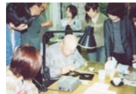
輪島漆芸技術研修所 授業風景(蒔絵科)