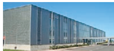
いしかわクリエイトラボ (能美市 いしかわサイエンスパーク内)

○スタートアップ段階にあるインキュベーション施設入居者に対するきめ細かな支援を行います。