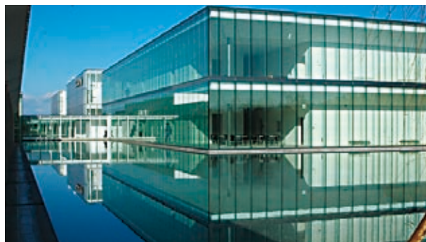
産学官連携の取組みを通じた企業誘致