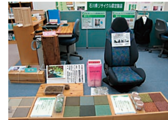
石川県リサイクル認定製品(県民エコステーション展示)