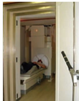
脳深部対応型MEG(脳磁計)システムの開発