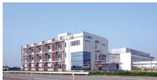
いしかわ大学連携インキュベータ