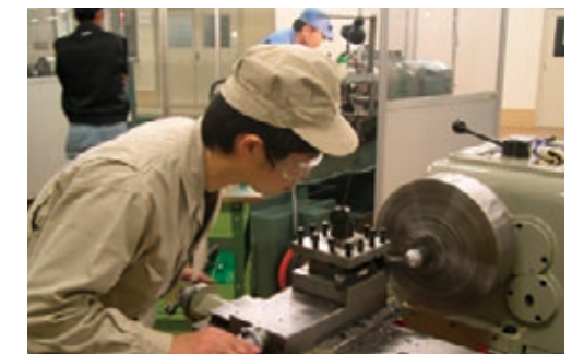
産業技術専門校等における研修