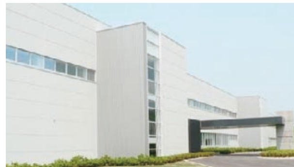
誘致企業の更なる設備投資