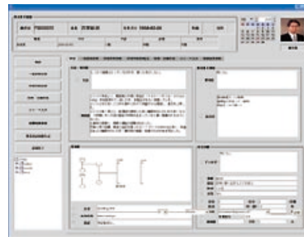
電子カルテの開発