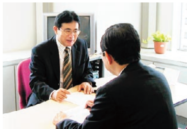
UIターンサポートセンターによる就職支援

○首都圏等の人材紹介会社と連携し、高度な専門技術を有する人材の誘致を促進します。 ○県内外の大学等と連携し、新卒者等の県内企業への就職を促進します。 ○UIターン相談の拡充を図り、本県出身者等のUIターンを促進します。