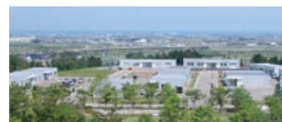
いしかわフロンティアラボ (能美市 いしかわサイエンスパーク内)