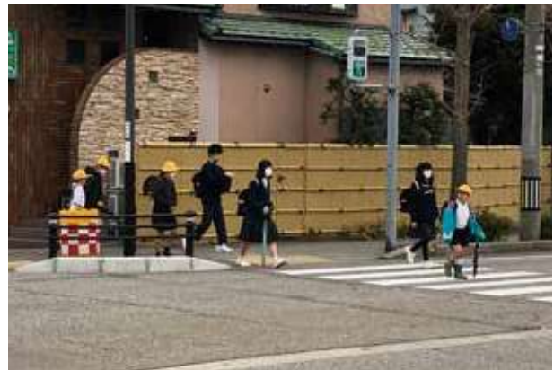
通学路における防護柵の設置