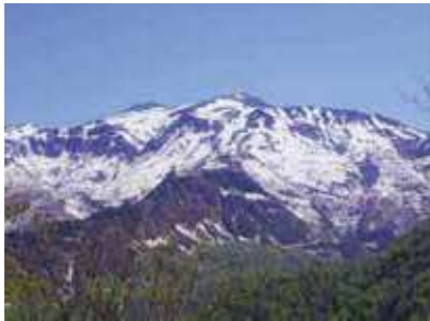
パノラマ展望台からの白山眺望

白山国立公園の利用促進を通して、多くの県民が、白山の豊かな自然への理解や関心を高めるとともに、地域資源としての価値を向上させ、地域の活性化につなげていきます。