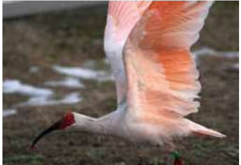
佐渡から県内に飛来した野生のトキ

早ければ令和8年度のトキ放鳥の実現に向けて、トキが生息できる環境整備や、トキと共生できる社会環境の整備を進めていきます。