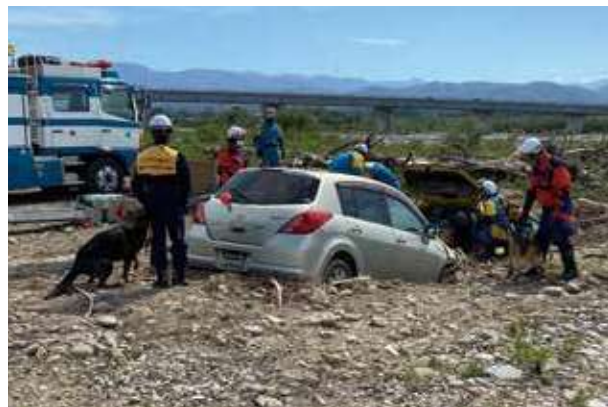
防災総合訓練の実施状況