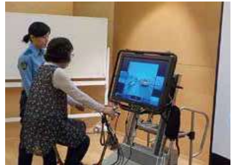
シミュレーターを活用した高齢者への交通安全教育