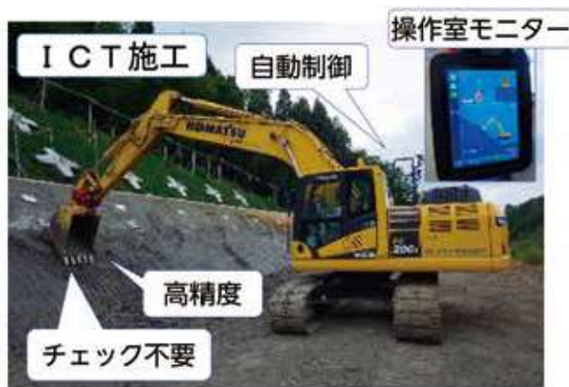
ICT施工（建設機械）による道路法面の整形