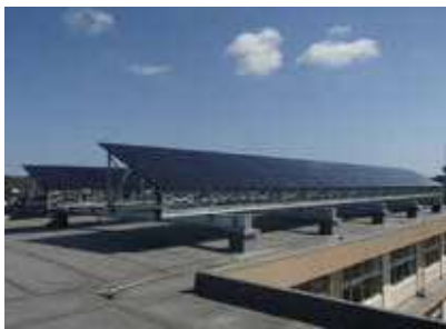
太陽光発電（志賀高等学校）