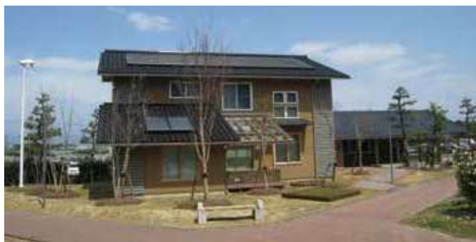
いしかわエコハウスの外観（石川県産業振興ゾーン）

脱炭素型ライフスタイルの定着に向けた気運を醸成するため、10月10日を「いしかわゼロカーボンの日」に制定し、県民や事業者へのライトダウンの呼びかけなどの啓発活動を展開します。