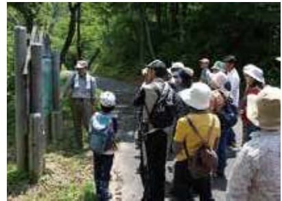
入門編としての低山ガイドツアー