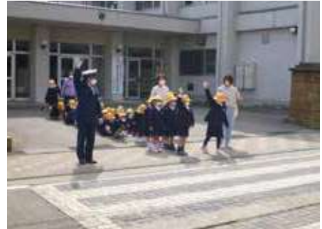
学校と連携した児童を守る交通安全運動

学校等と連携した登下校時における児童等の保護誘導活動や、高齢者に対するシミュレーター等の各種教育機材を活用した参加・体験・実践型の交通安全教育などを推進します。