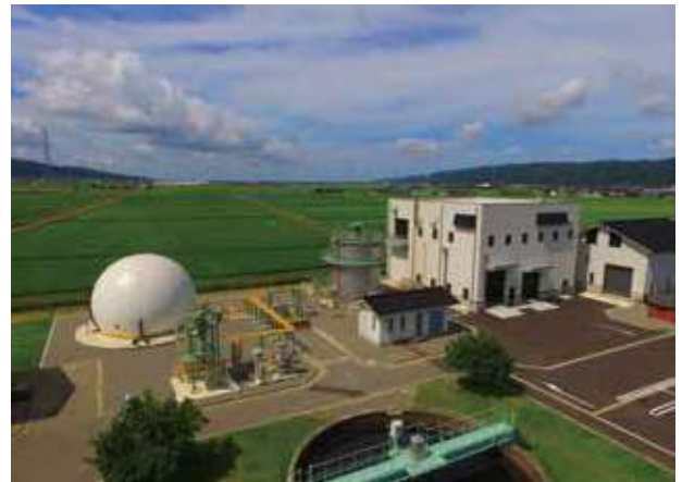
中能登町鹿島中部クリーンセンター

メタン発酵後の汚泥の肥料化による資源の循環利用や、食品廃棄物等の地域バイオマスから発生するメタンガスを再生可能エネルギーとして回収するなど、いしかわモデルの導入により地域循環型社会の形成につなげるとともに、地球温暖化防止にも貢献します。