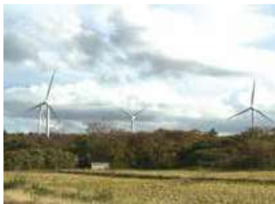
風力発電（福浦風力発電所）