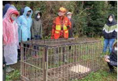
狩猟の魅力発信イベント

近年、有害鳥獣捕獲の担い手となる狩猟者の高齢化率が高くなっている中、捕獲体制を将来にわたって維持するため、若手などの新規狩猟者の確保や定着に向けた取組を進めます。