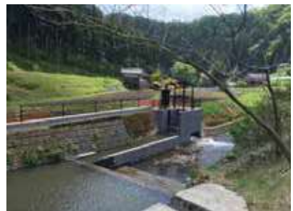
小水力発電（春蘭の里）