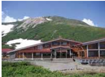
室堂ビジターセンター