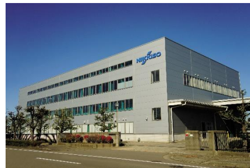
日機装(株)(日機装技研)