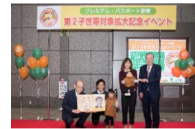
プレミアム・パスポート 第2子世帯拡大記念イベント