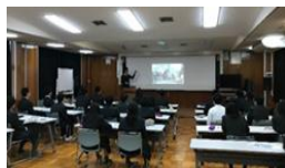
介護・福祉の仕事の魅力伝道師