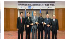
世界農業遺産党書締結