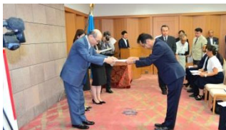
いしかわ産業化資源活用推進ファンド交付式