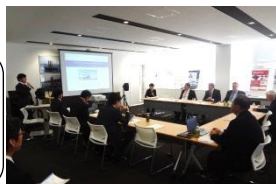
ドイツ・CFKハレーとの技術交流会

ドイツ・CFKハレーと金沢工業大学ICC等との技術交流会や商談会の実施 東海・北陸の研究機関等が連携したコンベンションの開催