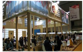
海外での旅行見本市への出展