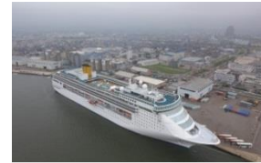
クルーズ船の定着促進