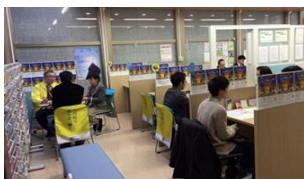
いしかわ就職・定住総合サポートセンター(ILAC)