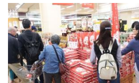
ひやくまん穀の市場デビュー