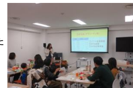
子育て世代向け移住セミナー(東京)