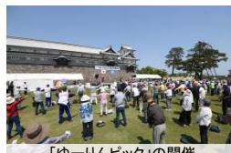
「ゆーりんピック」の開催