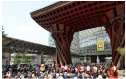
いしかわ・金沢 風と緑の楽都音楽祭