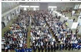
インターンシップマッチング交流会