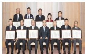
「いしかわ婚活応援優秀企業」の表彰