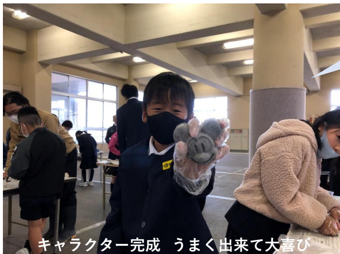
キャラクター完成 うまく出来て大喜び