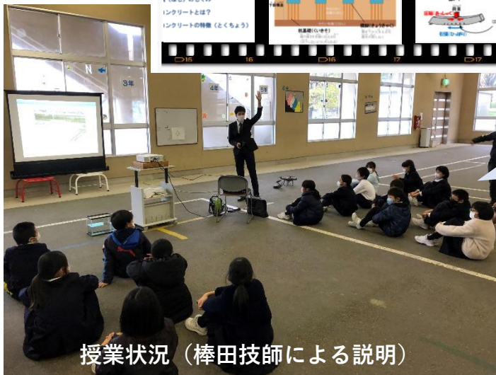
授業状況（棒田技師による説明）