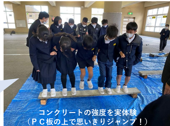
コンクリートの強度を実体験（PC板の上で思いきりジャンプ！）