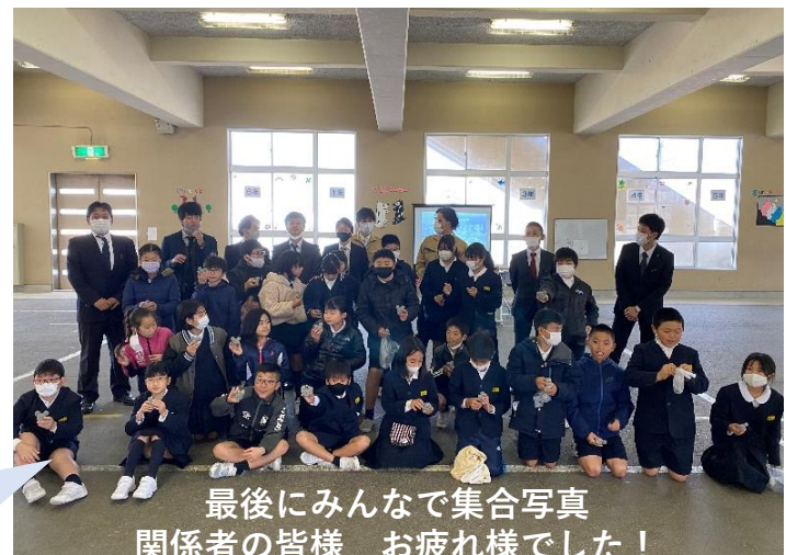
最後にみんなで集合写真関係者の皆様 お疲れ様でした！