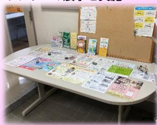
↑こまつまちづくり交流センターチラシを設置