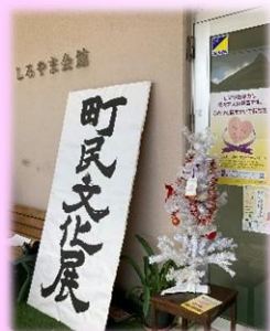
地域のイベントにあわせてツリーを設置

女性協議会主催事業にてパープルリボンピンバッジ着用し、来場者へのメッセージカードの配布やツリーの展示を実施