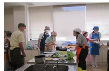
男性の料理教室（山代地区）