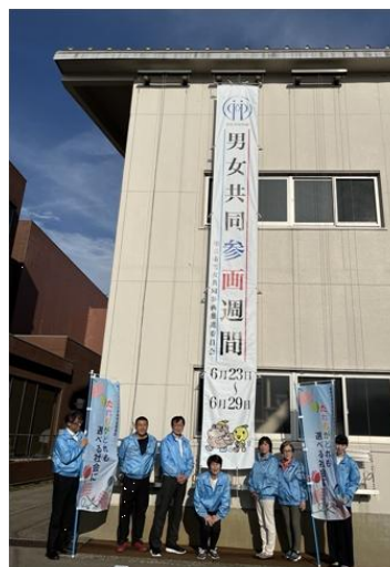
懸垂幕掲揚の様子