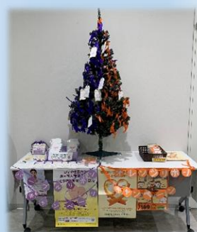
↑カブッキーランド内