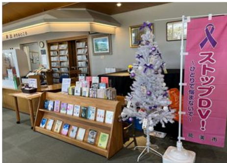
パープルリボンツリーと関連図書展示

市内3図書館にパープルリボンツリーとメッセージカード、ポスター、チラシ等を設置しました。また、その後、手取フィッシュランドに移動して、啓発グッズを配布しながら、児童虐待防止・DV防止を呼びかけました。