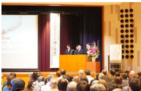
寺井高校生による発表