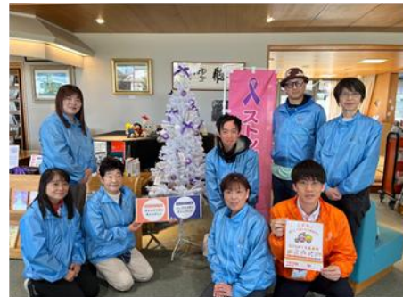
パープルリボンツリー設置の様子