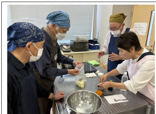
ポリ袋クッキングの様子