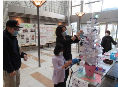
▲メッセージをツリーに飾る来場者ら

さらに、ポリ袋で簡単に作れる防災食の見本を行程ごとに展示し、災害時だけでなく普段から家庭で活用してもらえようレシピを紹介しました。