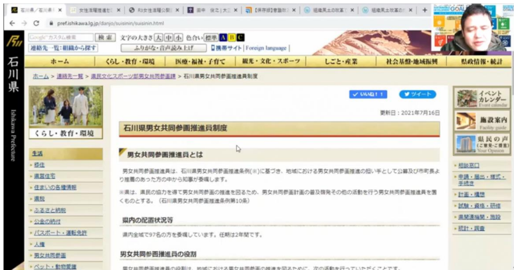
You Tube 投稿動画

URL https://www.youtube.com/watch?v=ndPplwJWvjw