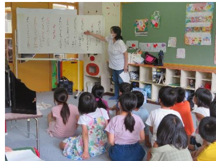
▲紙芝居の歌を歌う児童たち