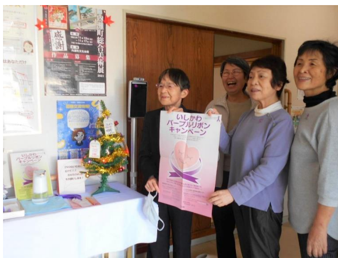
キャンペーン準備の様子