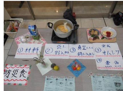
▲防災食の見本とレシピ