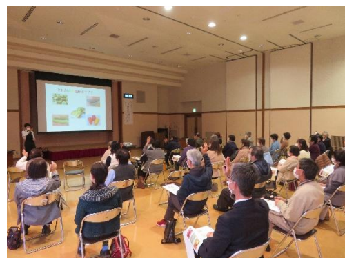
▲どの野菜が緑黄色野菜かを確認する参加者