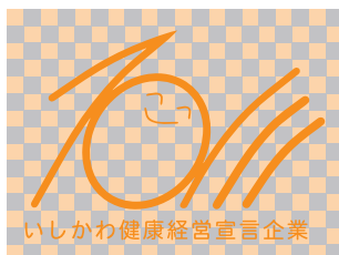
× 視認性を妨げる背景の使用