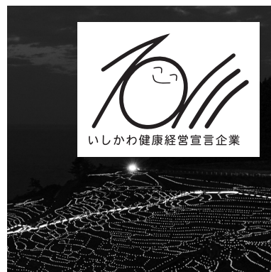
○ 白窓付きの使用 (スミ1色の場合)