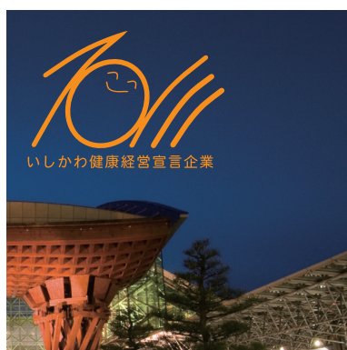
○ 濃い背景写真の上に基本色使用