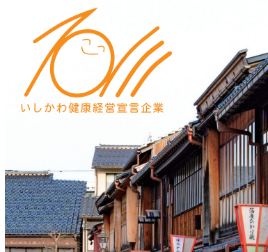
○ 薄い背景写真の上に基本色使用