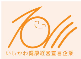
○ 極薄い背景色に基本色使用