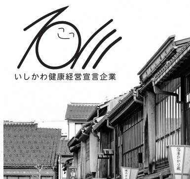
○ 薄い背景写真の上にモノクロ使用