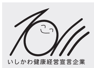
○ 極薄い背景色にモノクロ使用 (スミ1色の場合)