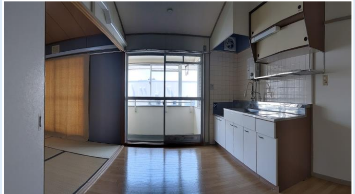
ダイニング・キッチン