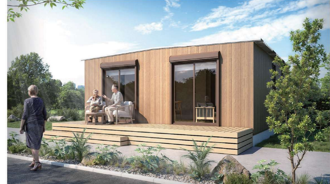
※ウッドデッキを含む外構、植栽は別途工事になります。