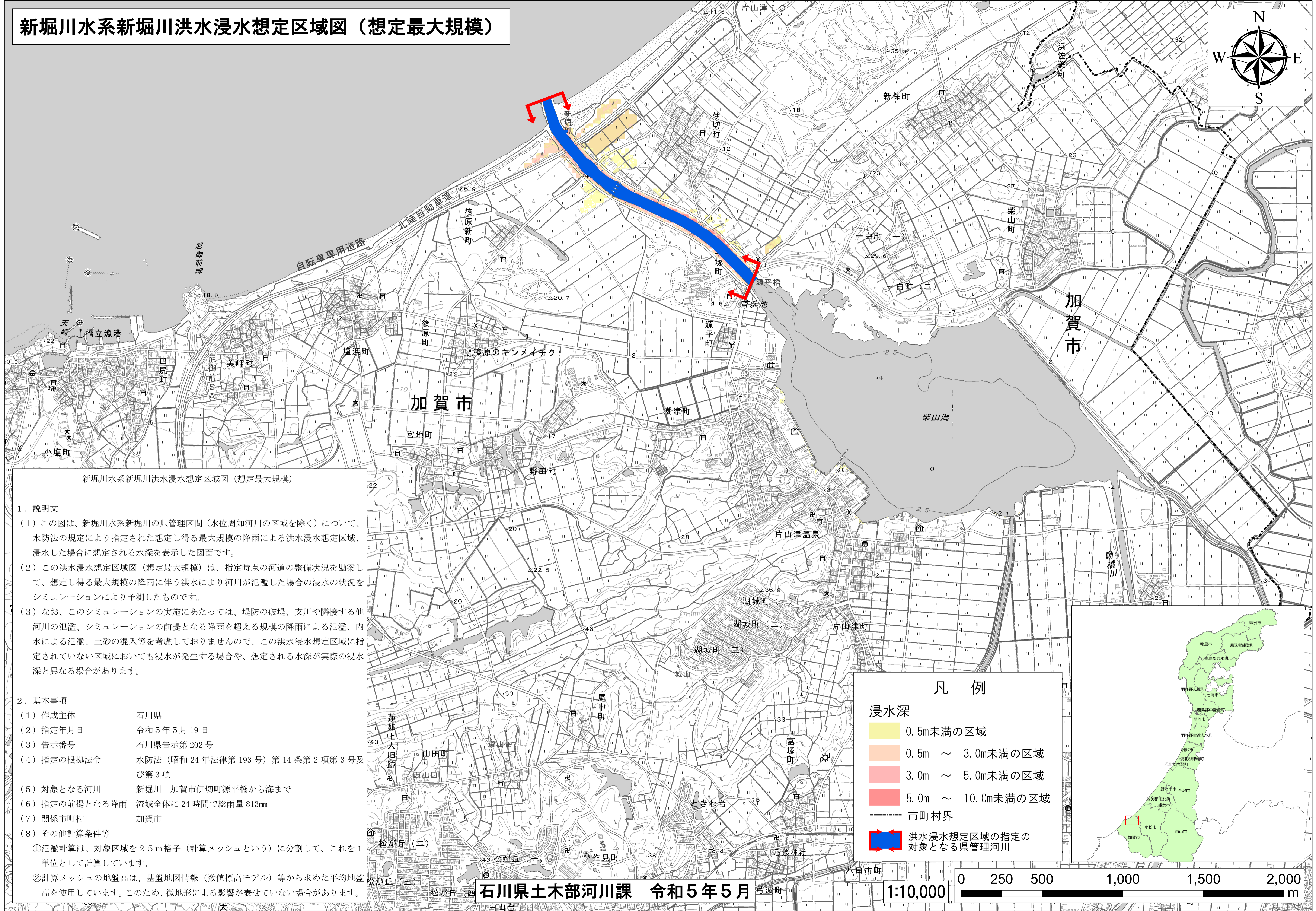
新堀川水系新堀川洪水浸水想定区域図（想定最大規模）