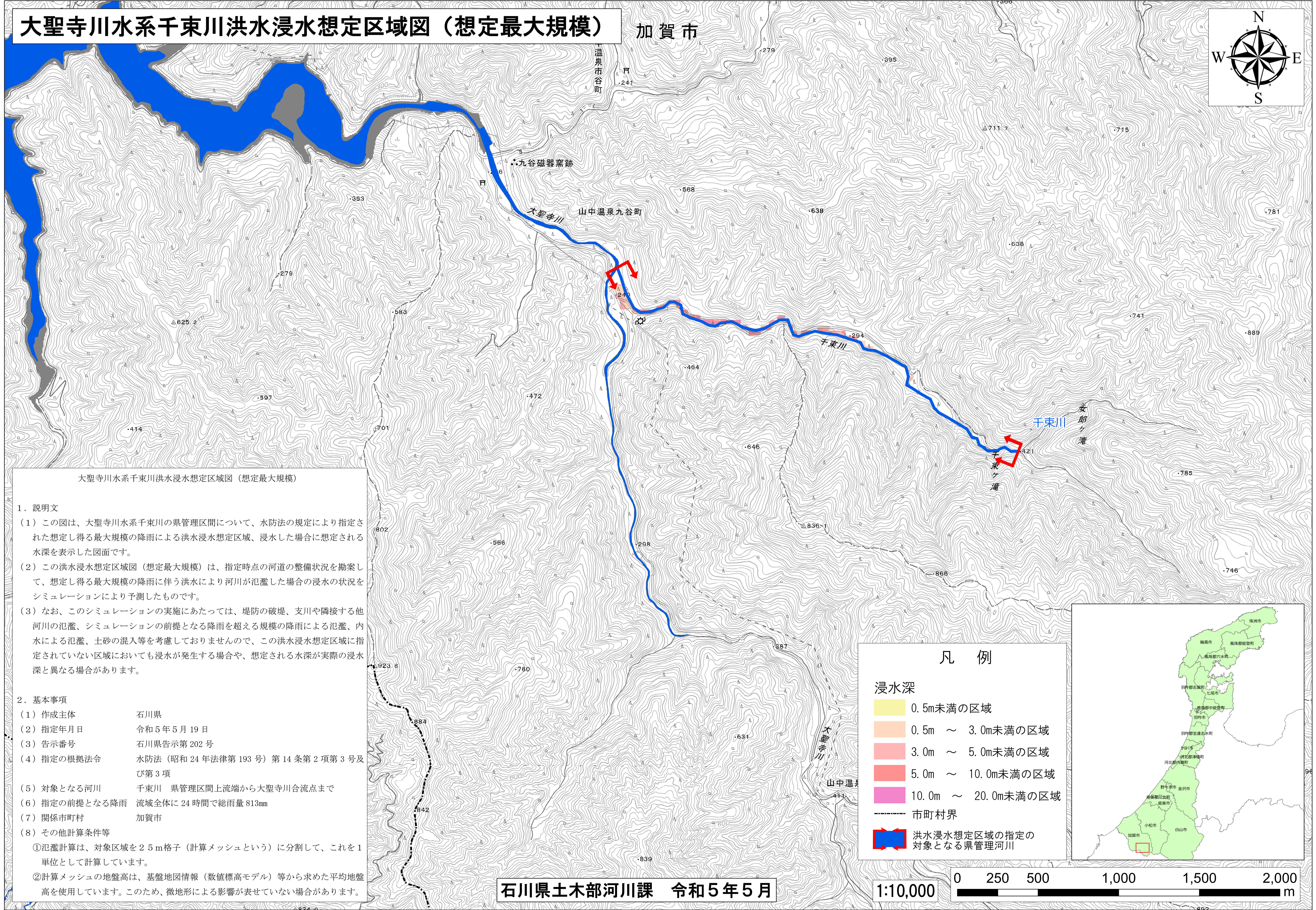
大聖寺川水系千束川洪水浸水想定区域図（想定最大規模）