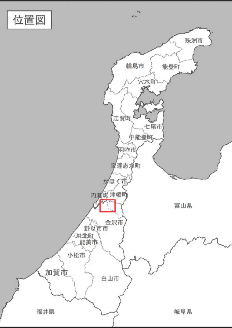
大野川水系森下川洪水浸水想定区域図(家屋倒壊等氾濫想定区域(氾濫流))