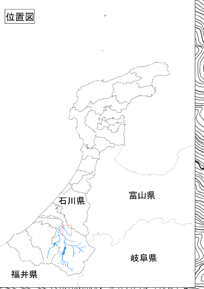
手取川水系直海谷川洪水浸水想定区域図（想定最大規模）