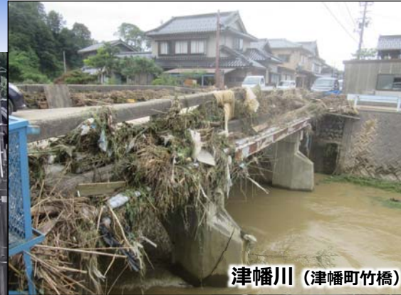
津幡川（津幡町竹橋）

※具体的な対策内容については、今後の調査・検討等により変更となる場合があります。 ※スケジュールは今後の事業進捗によって変更となる場合があります。