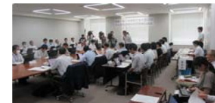
第1回検討部会の開催状況 (令和5年8月31日)