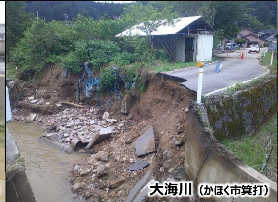
大海川（かほく市箕打）