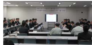
第2回検討部会の開催状況 (令和5年11月24日)