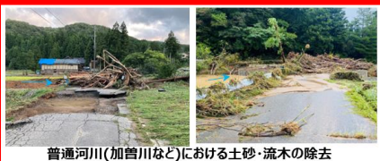
普通河川(加曾川など)における土砂・流木の除去