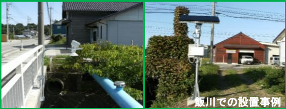
飯川での設置事例