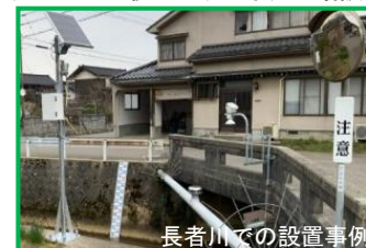
砂防関係施設の整備 (石川県)