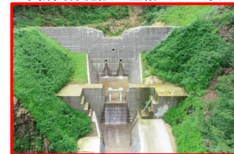
砂防関係施設の整備 (石川県)