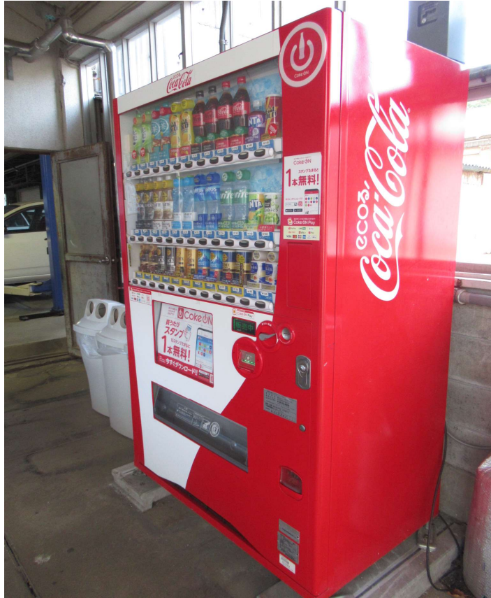
コンセント位置 自動販売機後方