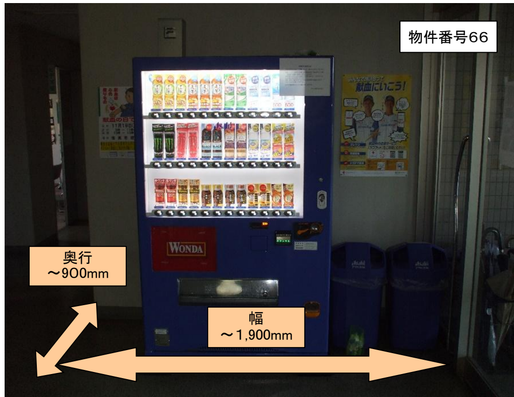
コンセント位置 物件番号66 自動販売機後方