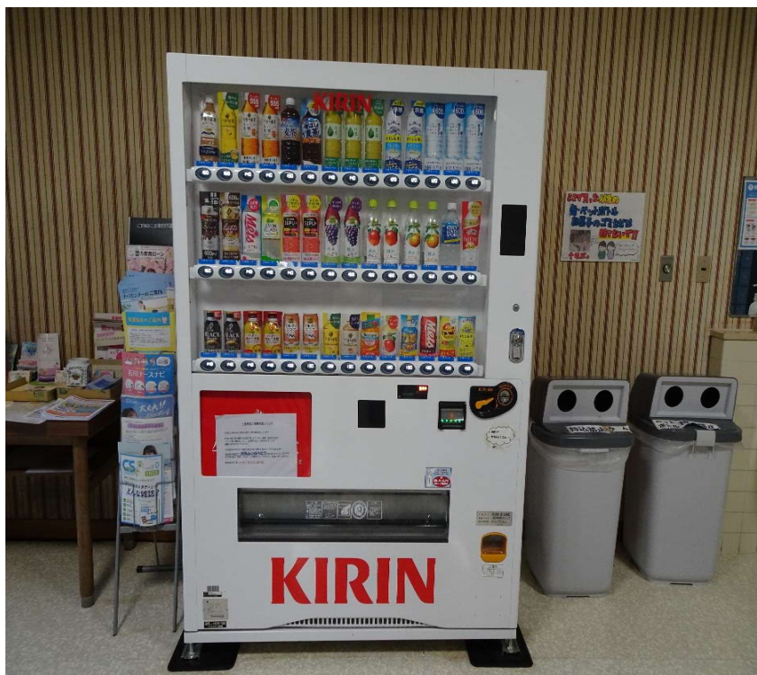
コンセント位置 自動販売機後方