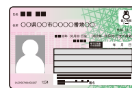
マイナンバーカード 等