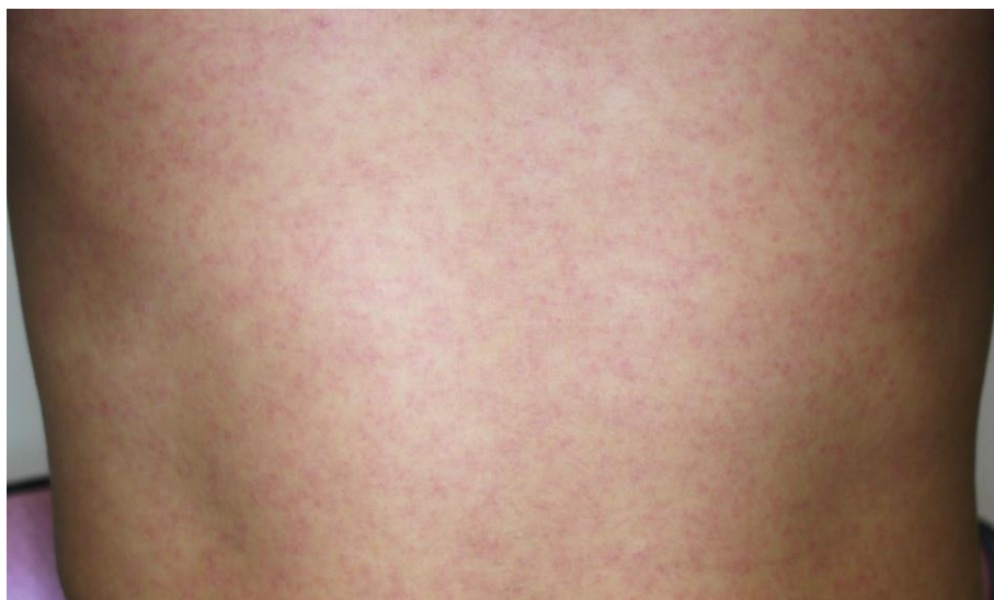
図3. ジカウイルス病の斑状丘疹様の発疹

潜伏期間は、2～12日（多くは2～7日）である。ジカウイルス病の臨床症状は多彩であるが、斑状丘疹様の発疹（ 図3 ）は90～100%に認められるのに対して、発熱の頻度は35～65%とされている 29,47 。また発疹は掻痒感を伴うことが多いとされている。また、大半の症例は入院を必要としなかった。 表7 に2015年のブラジル・リオデジャネイロにおけるジカウイルス病患者が発症後4日以内に認めた臨床症状を示す 47 。