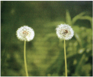
「病者が病者でいられる社会」1990年5月 万博日本庭園