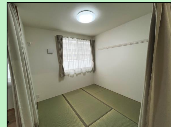
① 門前第1団地（輪島市門前町清水地内）