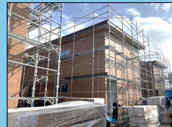
③ 釜屋谷町第1団地 （輪島市釜屋谷町地内）