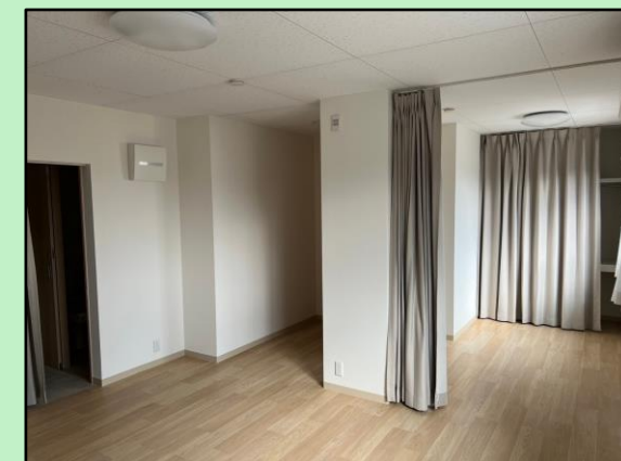
② 野々江町第8団地（珠洲市野々江町地内）