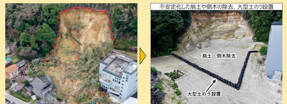
[C] 宗玄地区（珠洲市宝立町宗玄地内）