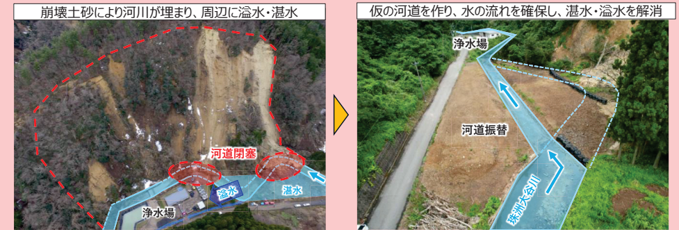
[A] 珠洲大谷地区（珠洲市大谷町地内）