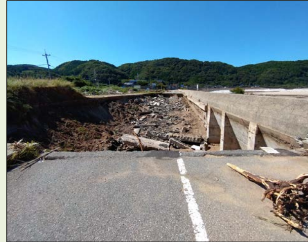
① 県道266号（五十洲亀部田線）輪島市門前町五十洲

12月下旬に、七浦地区へ繋がる県道266号(五十洲亀部田線)など、5路線9箇所の通行止めを解除し、一般車両が通行可能となりました