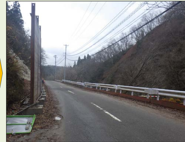
③ 県道280号（若山上戸線）珠洲市若山町上黒丸