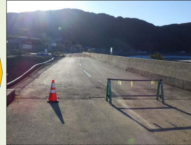
② 県道26号（珠洲穴水線）鳳珠郡能登町黒川