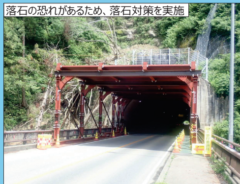
[A] 県道1号（七尾輪島線） 輪島市熊野町地内 [熊野トンネル]