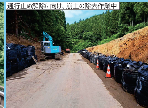
[B] 県道51号（輪島富来線） 輪島市空熊町地内