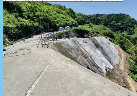
[C] 県道38号(輪島浦上線) 輪島市下山町地内