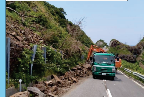
[B] 県道28号(大谷狼煙飯田線) 珠洲市高屋町地内