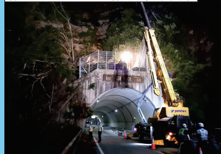
[A] 県道1号(七尾輪島線) 輪島市熊野町地内 [熊野トンネル]