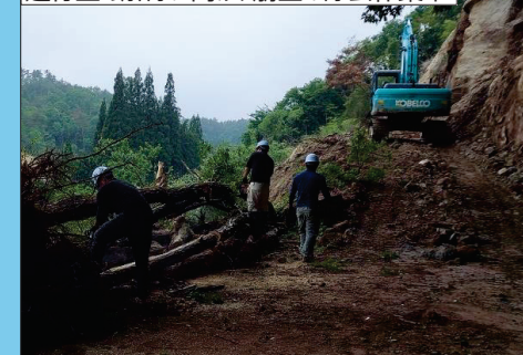
[D] 県道26号(珠洲穴水線) 珠洲市宝立町泥木地内