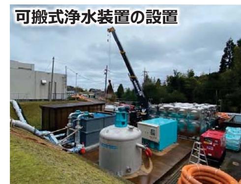
可搬式浄水装置の設置