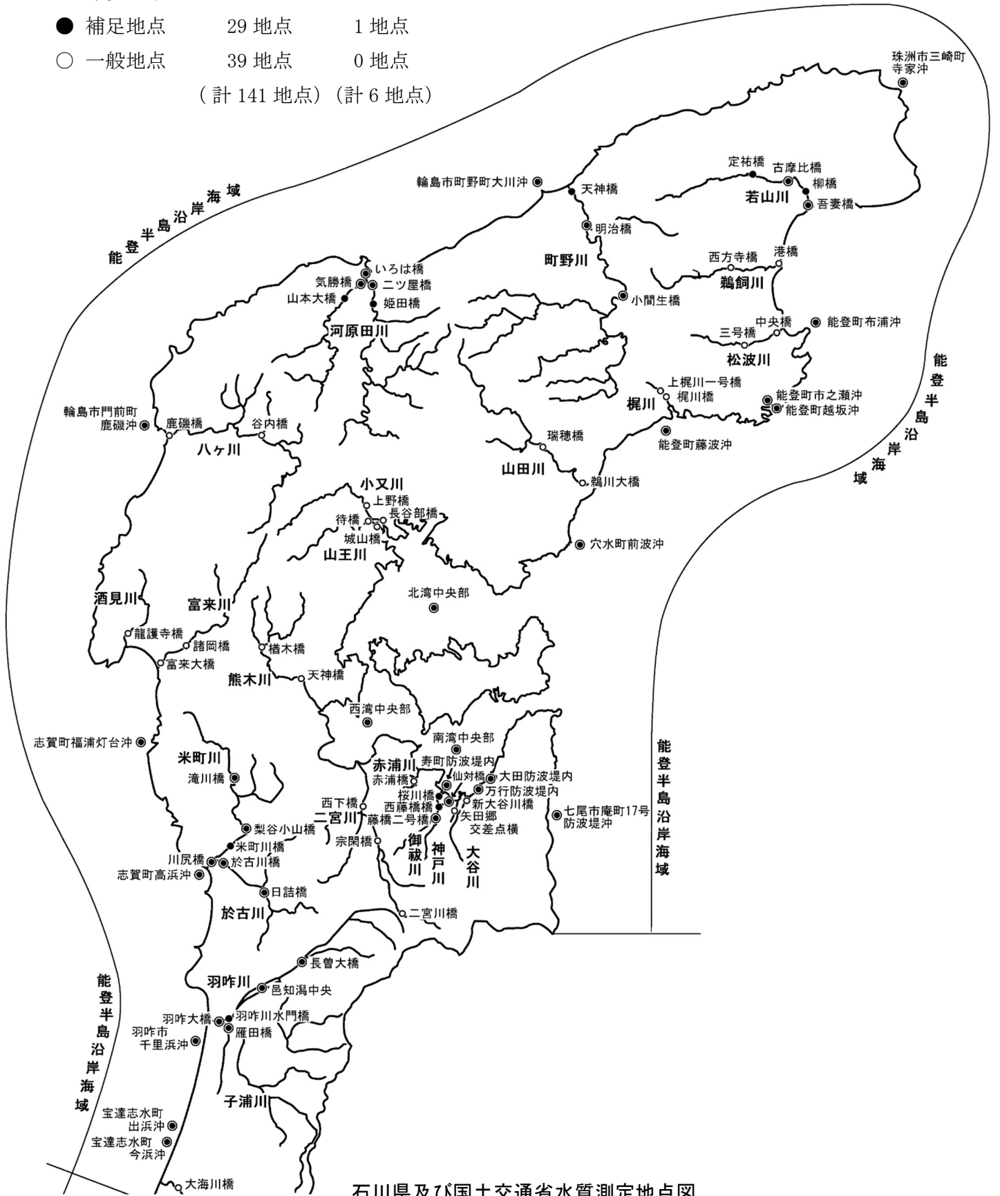
石川県及び国土交通省水質測定地点図