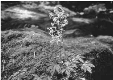
エチゼンダイヤモンドジソウ