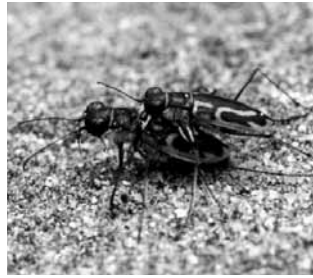
イカリモンハンミョウ