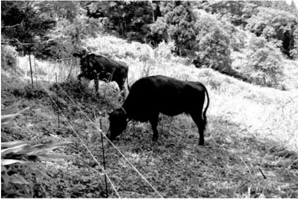
和牛放牧（白山市瀬波）

後は、これまで頻繁であったサルの出没も少なくなり、クマの出没もなく、放牧の効果が見られました。本年度も引き続き実施することになっています。