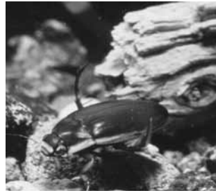
シャープゲンゴロウモドキ