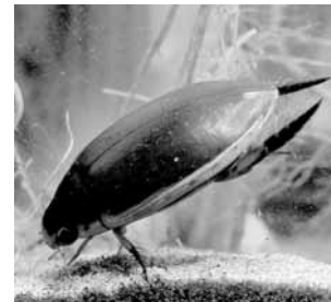
マルコガタノゲンゴロウ