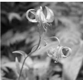
サドククルマユリ