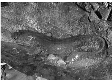
アベサンショウウオ