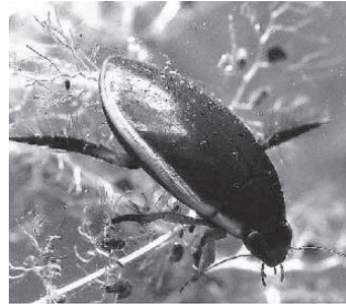
マルコガタノゲンゴロウ (ゲンゴロウ科)