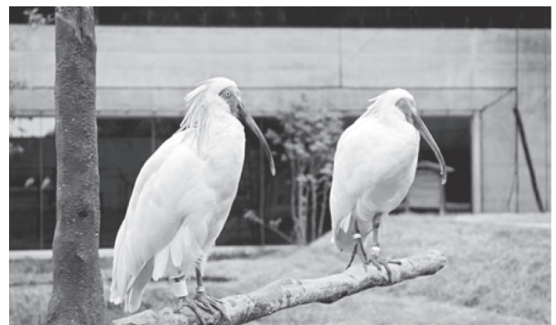
いしかわ動物園で分散飼育中のトキ