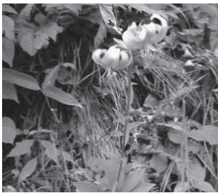
サドククルマユリ (ユリ科)