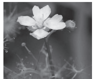
イシモチソウ (モウセンゴケ科)