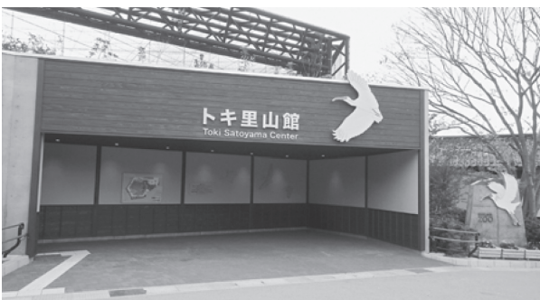
トキ里山館（平成28年11月オープン）

今後も、トキを通じて里山の利用保全を推進するなど、人と自然の共生の取組を進めていきたいと考えています。