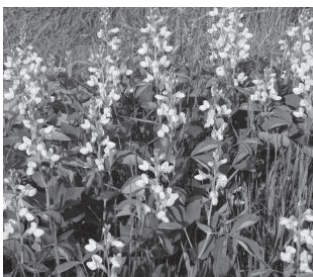
センダイハギ (マメ科)