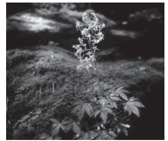
エチゼンダイモンジソウ (ユキノシタ科)