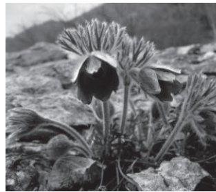
オキナグサ (キンポウゲ科)