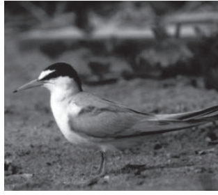
コアジサシ (カモメ科)