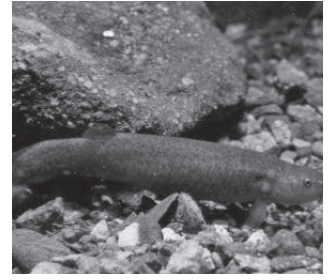
ホトケドジョウ (ドジョウ科)