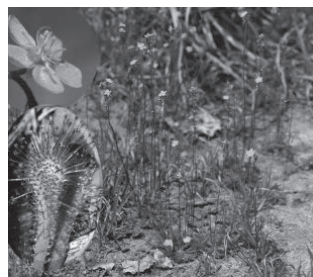
トウカイコモウセンゴケ (モウセンゴケ科)