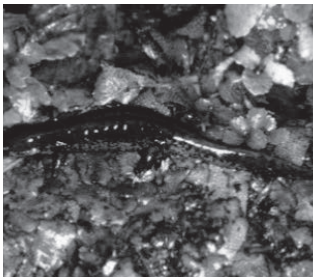
ホクリクサンショウウオ (サンショウウオ科)