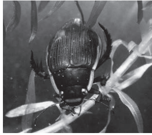
シャープゲンゴロウモドキ (ゲンゴロウ科)