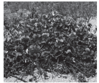
イソスミレ (スミレ科)