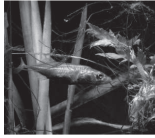
トミヨ (トゲウオ科)