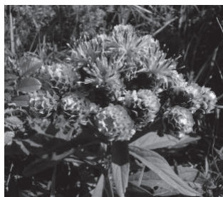
ヒメヒゴタイ (キク科)