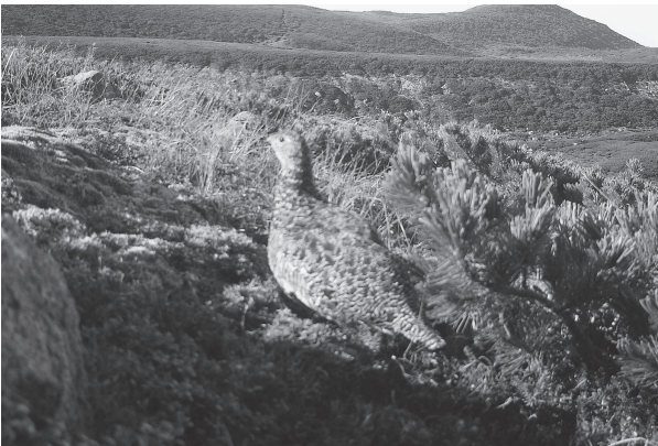
白山のライチョウ（平成27年8月24日撮影、環境省中部地方環境事務所）

白山は、かつてのライチョウの生息地であり、平成21年6月のライチョウの再確認は、大きなニュースとなって県民に明るい話題を提供しました。確認されたライチョウは、メスの1羽だけでしたが、白山の自然の豊かさを象徴しています。今後も県では、環境省と連携し、ライチョウの目撃情報の把握に努めてまいります。