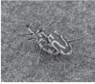
イカリモンハンミョウ (ハンミョウ科)