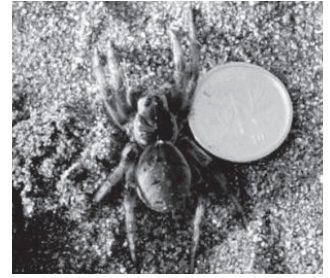
イソコモリグモ (コモリグモ科)